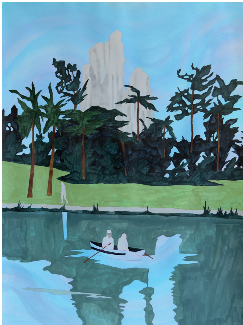
Rocher blanc , encre sur papier, 2019

Vernissage le jeudi 29 juin de 18h à 22h