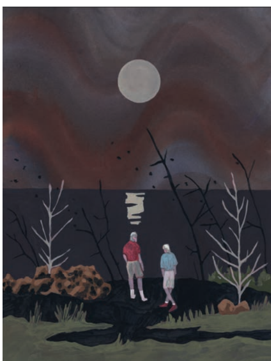
Météo , encre et peinture vinylique sur papier, 2019