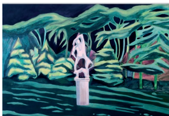
Parc , huile sur papier, 2017