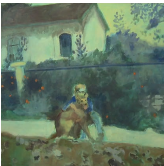
La Maison du chemin de fer , huile sur toile, 2010