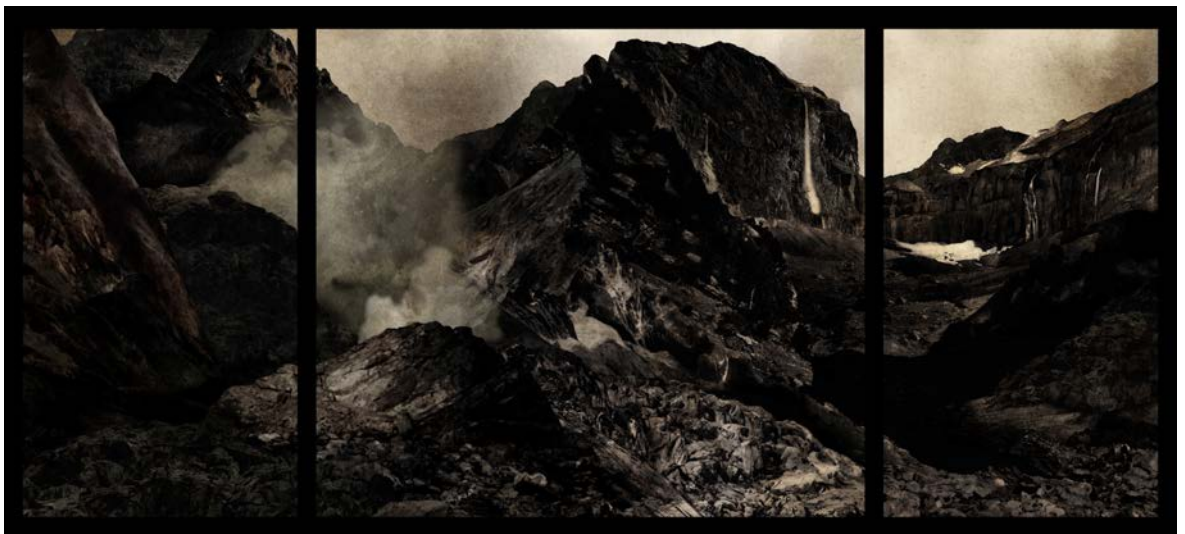
Vous qui entrez ici © Vergine Keaton

Vergine Keaton est artiste associée aux Ateliers Médicis depuis 2019. Elle est également enseignante à L'Ensad (École nationale supérieure des arts décoratifs) à Paris et membre du Comité d'administration de la SRF (Société des réalisateurs de films).