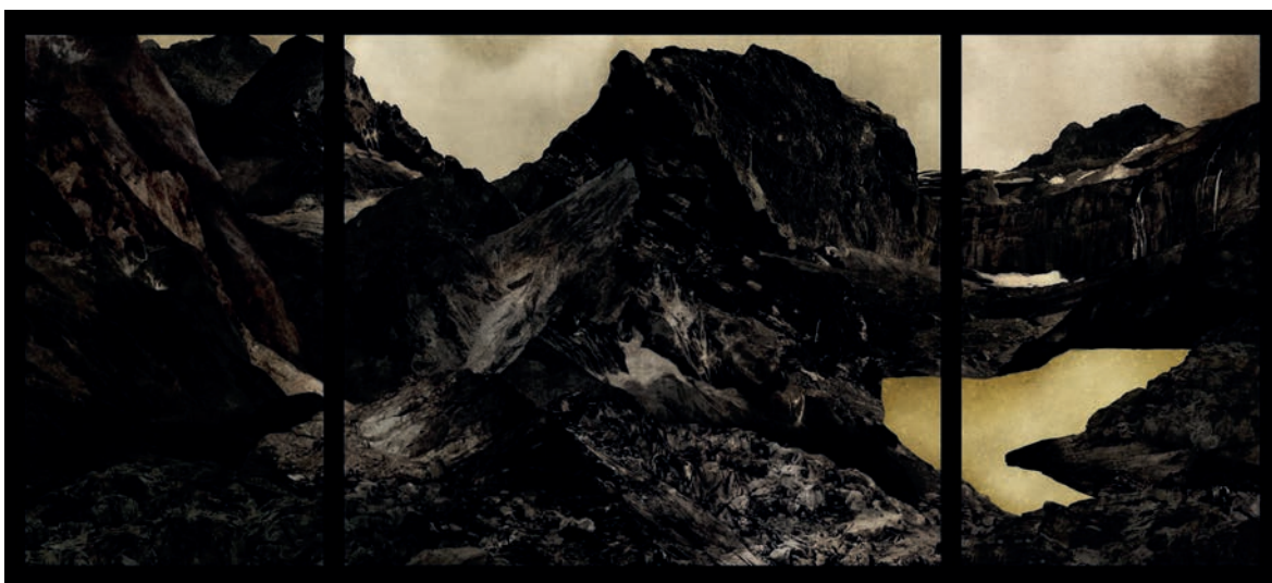
Vous qui entrez ici © Vergine Keaton

Vernissage le mardi 25 octobre de 10h à 18h