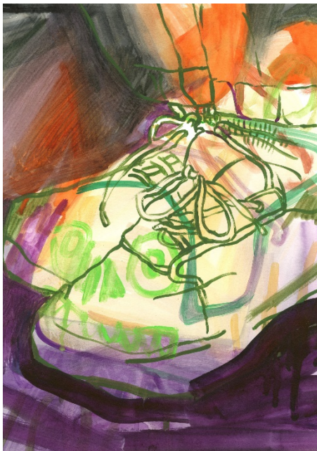
Ghost Shoes Acrylique, gouache, Aquarelle sur papier, 2022