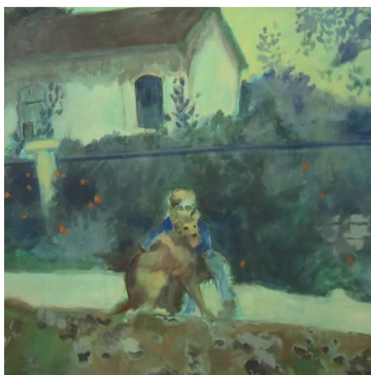
La Maison du chemin de fer , huile sur toile, 2010