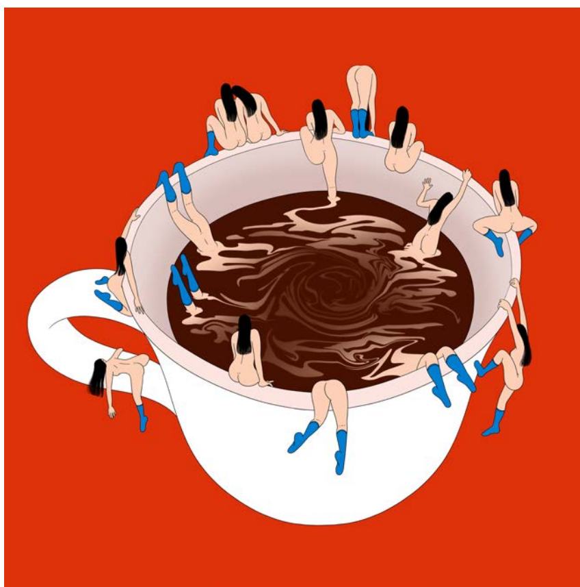
Untitled, 2022 © Sawako Kabuki

Ses films ont été sélectionnés et récompensés lors de nombreux festivals internationaux dans plus de 20 pays, notamment à Annecy, Ottawa, Zagreb, Rotterdam, Sundance et SXSW. Son film, Summer's Puke is Winter's Delight (2016) fut le premier film étudiant japonais à remporter un prix à Annecy.