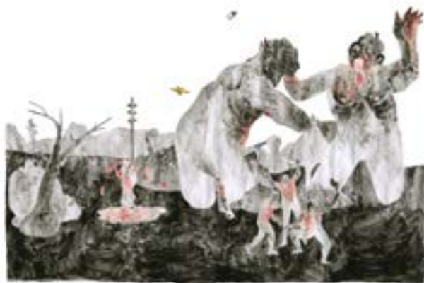
La Chute , aquarelle et à l'encre de Chine sur feuille d'animation, 42 x 29,5 cm, 2017-2018