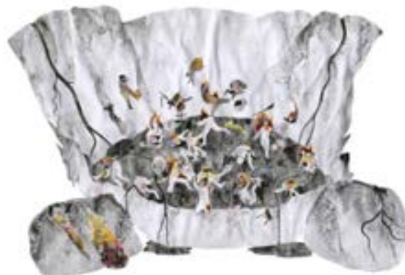
La Chute , aquarelle et à l'encre de Chine sur feuille d'animation, 42 x 29,5 cm, 2017-2018