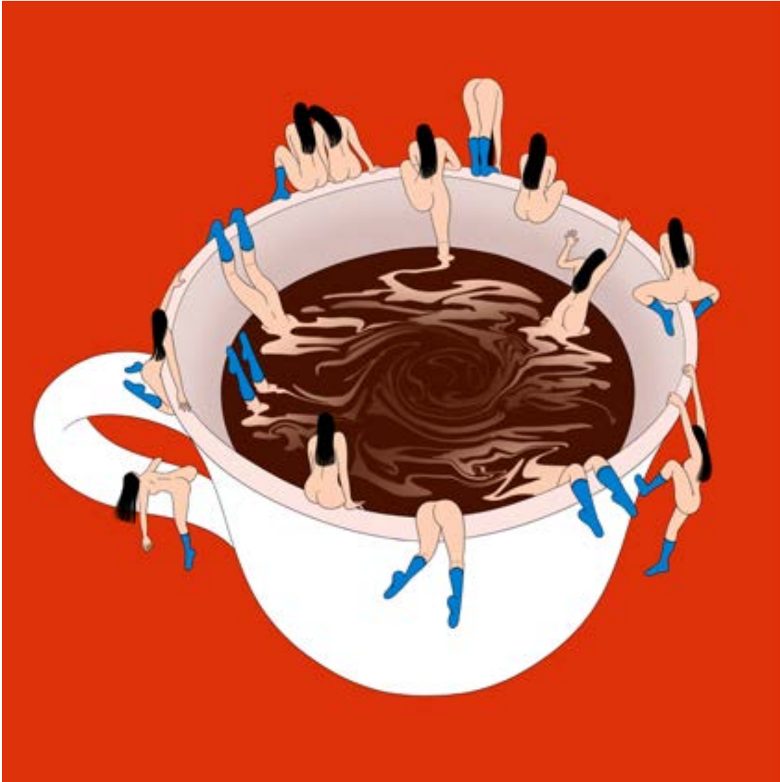
Sawako Kabuki, Coffee , impression numérique, 70x70 cm, 2022