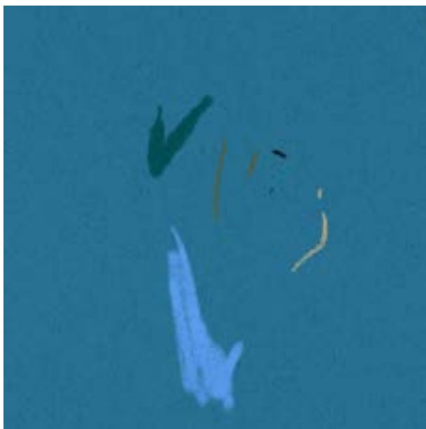
Sébastien Laudenbach, Anna 040 , impression numérique, 15x15cm 2022