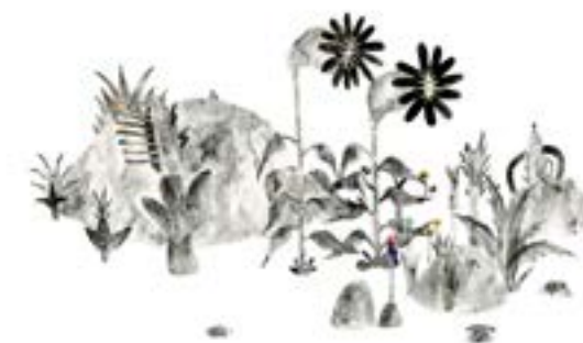
La Chute , aquarelle et à l'encre de Chine sur feuille d'animation, 42 x 29,5 cm, 2017-2018