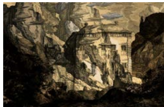
Vergine Keaton, Trois fois là-bas 1/2/3/4/5/6 , impressions numériques, 35x22,5 cm, 2022