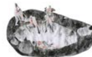
La Chute , aquarelle et à l'encre de Chine sur feuille d'animation, 42 x 29,5 cm, 2017-2018