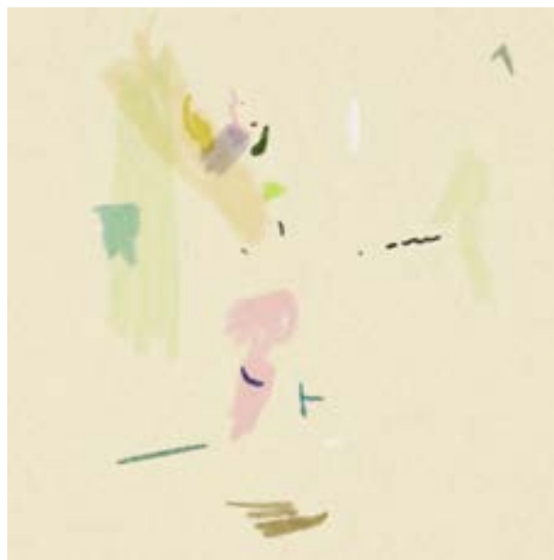
Sébastien Laudenbach, Anna 52 , impression numérique, 15x15 cm 2022