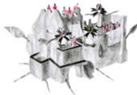
La Chute , aquarelle et à l'encre de Chine sur feuille d'animation, 42 x 29,5 cm, 2017-2018